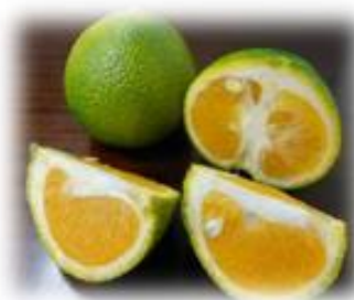
スイートスプリング