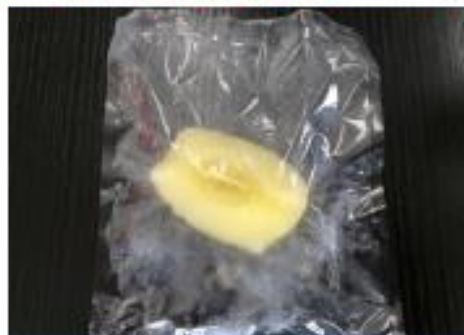
フローズンアップル