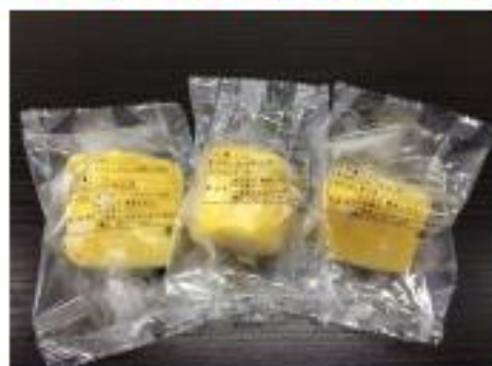
沖縄パイン(カット)