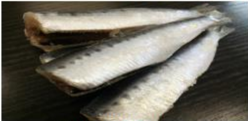
*上記の写真は約15gの物になります