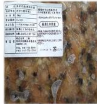
熊本県原料 メーカー/三華