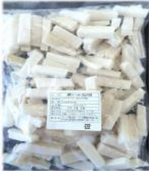
青森県原料 メーカー/タイヘイ