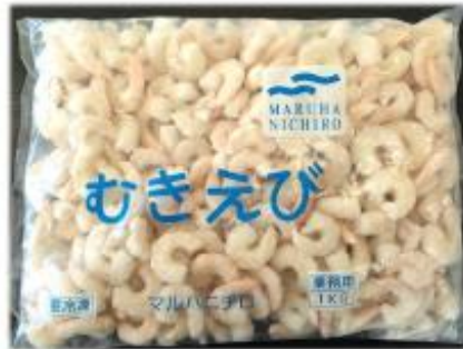
パキスタン原料 メーカー/マルハニチロ