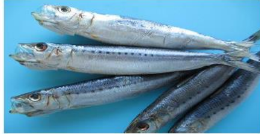
* 上記の写真は約15gの物になります