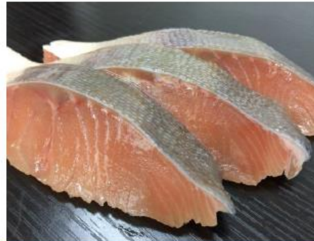
魚波商店 マス (北海道産・加工)