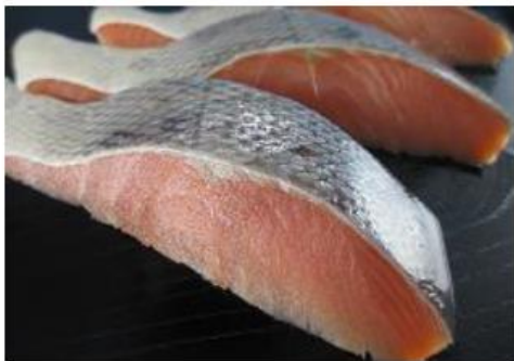
魚波 秋サケ (北海道・三陸産・加工)