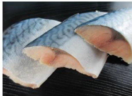
匠水産 さば (ノルウェー産)

(千葉県加工品) (ベトナム加工品) 20g 20g 30g 30g 40g 40g 50g 50g 60g 60g 70g 70g