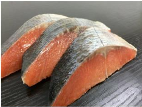
匠水産 秋サケ (ロシア産)

今回のご案内する秋サケロシア産は、ロシア極東地域を流れているアムール川を上る秋サケを漁獲したものです。豊かな自然環境の中で産卵に帰る川が非常に長い為、通常のサケとは脂肪分の含有率が全く異なります。(一般的な秋サケの脂肪含有率 約4% / 秋サケロシア産の脂肪含有率 約10%)