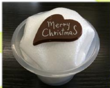
ミニハート(クリスマス)