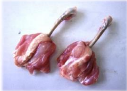
チューリップ(国産 手羽先使用) 1本約40gで可食部は30g前後です