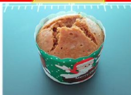
クリスマス柄 ケーキカップ