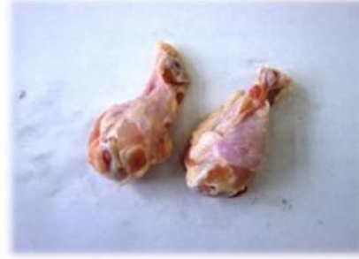
手羽元(国産) 1本約50gで可食部は30g前後です