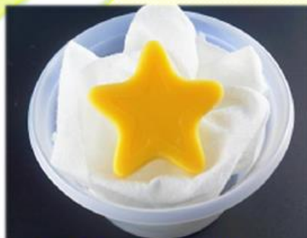
モチーフスター(イエロー)