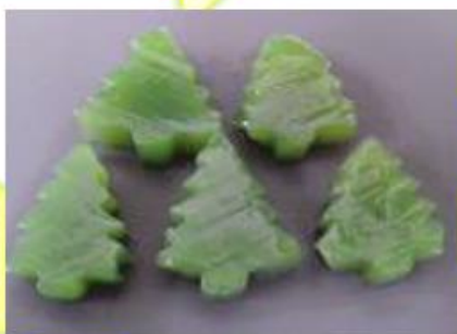
絵模様寒天 モミの木型・星型 1kg