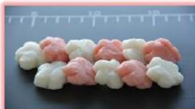
花型 しんじょう (3色) 約5g/個