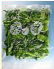
千葉県産 冷凍菜の花 500g /袋