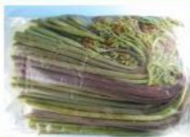
国産 わらび水煮(ロング) 1kg