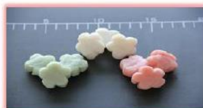
花型 はんぺん (紅白) 約4g/個