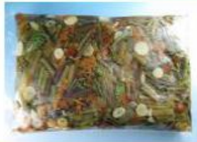
国産 山菜ミックス水煮 1kg