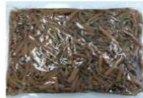
国産 ぜんまい水煮(カット) 1kg