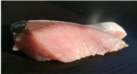
魚波 冷凍ぶり (北海道・三陸産)