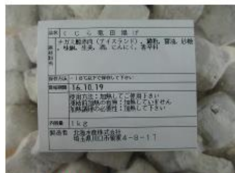
竜田揚げ (2×2×2cm) 冷凍 / kg