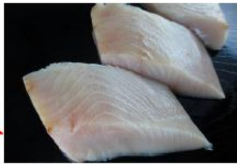
魚波 秋サケ (北海道・三陸産・加工)