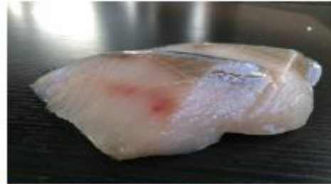
匠 生鮮ぶり (大分県産)