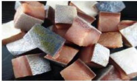
魚波 ぶり角切り (北海道・三陸産)