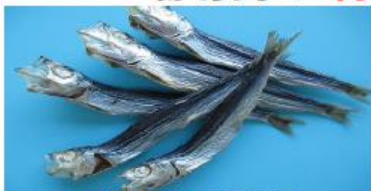
* 上記の写真は15gの物になります