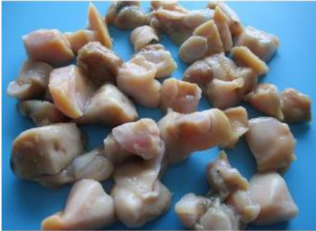
本ビノス貝・小松菜・人参のご当地シチュー

東京湾内で繁殖している外来種。北アメリカ原産で、クラムチャウダーに使用されるなど、北米では重要な食用貝です。外国船舶のバラスト水に稚貝が混ざり、船橋三番瀬に定着しました。船橋などで漁獲を始め、2000年代に入ってから流通し始めました。現在ではアサリと並び、大量に水揚げされています。